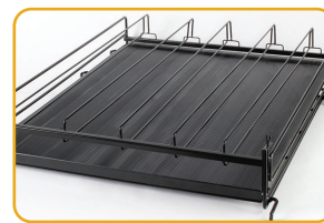
ÉTAGÈRES À FLUX PAR GRAVITÉ