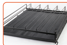
ÉTAGÈRES À FLUX PAR GRAVITÉ