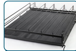
ÉTAGÈRES À FLUX PAR GRAVITÉ