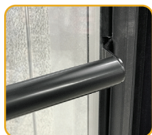
BARRE DE POUSSÉE

Entièrement conforme aux réglementations DOE 2017