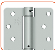
SYSTÈME À 3 CHARNIÈRES