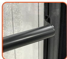
BARRE DE POUSSÉE

Entièrement conforme aux réglementations DOE 2017