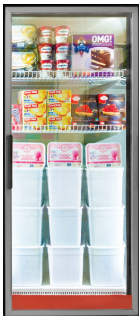
EnVision 2 (95 CRI)