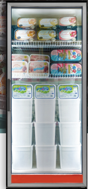
EcoLED (85 IRC)